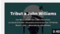
Tribut a John Williams 843 visualitzacions · hace 1 año