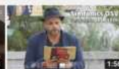
Connecta't als Simfònics de l'OSV - Tèa. 2019/2020 595 visualitzacions · hace 1 año