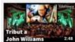
OSV_Tribut a John Williams 251 visualitzacions · hace 1 año