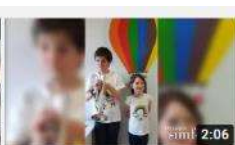
LA MÚSICA ES DE QUIEN LA NECESITA. Orquesta... 1886 visualitzacions · hace 11 meses Subtítulos