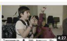
Projecte OSV. Beethoven 250 131 visualitzacions · hace 1 año