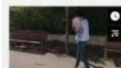
OSV_Tribut a John Williams | 1er premi: FM2 Escola... 481 visualitzacions · hace 1 año