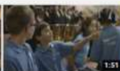
Beethoven 250, el projecte social de l'OSV 397 visualitzacions · hace 1 año