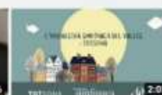
OSV. Es l'hora de forquestra. Dàmaris Gelabert Simfònica 1099 visualitzacions · hace 1 año