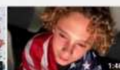
OSV_Tribut a John Williams | 2on premi: RF1 Escola... 219 visualitzacions · hace 1 año