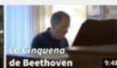
OSV. La Cinquena de Beethoven dirigida per... 370 visualitzacions · hace 1 año