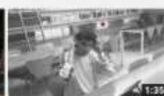
OSV_Tribut a John Williams | 2on premi: FM3 Escola... 208 visualitzacions · hace 1 año