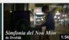
Simfonia del Nou Món de Dvorák 1062 visualitzacions · hace 1 año