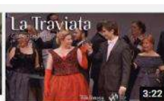
La Traviata de Verdi en concert amb l'OSV 507 visualitzacions · hace 1 año