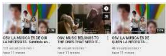
OSV. LA MÚSICA ES DE QUIEN LA NECESITA. Subtítols en... 1011 visualitzacions · hace 11 meses

Realitzats per Xavier Pijuan · Laboina Produccions