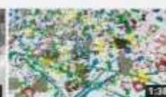
OSV_Tribut a John Williams | 1er premi: RF2 Escola Ram... 257 visualitzacions · hace 1 año