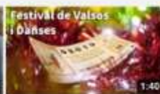
OSV. Festival de valsos i danses 2019-2020 723 visualitzacions · hace 1 año