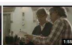
OSV. Concert per a pi4no de Beethoven 248 visualitzacions · hace 1 año