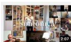
LA NOSTRA MILLOR SIMFONIA ETS TU. Orquest... 857 visualitzacions · hace 11 meses