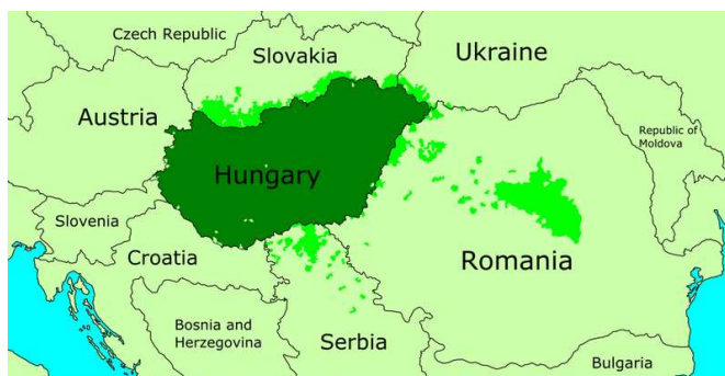
Majories ètniques hongareses a les regions veïnes d'Hongria

1 Aquesta regió és anomenada en romanès Transilvania ("més enllà del bosc", nom derivat del llatí, llengua oficial a la regió fins al segle XIX), en hongarès Erdély (el mateix significat). En aquells temps constituïa un principat i formava part d'Hongria. Els romanesos també l'anomenen Țara Ungureasca (Terra dels hongaresos). Actualment forma part de Romania, juntament amb Moldàvia i Valàquia amb qui es va unir l'any 1918, i suposa més de la meitat de la seva superfície.