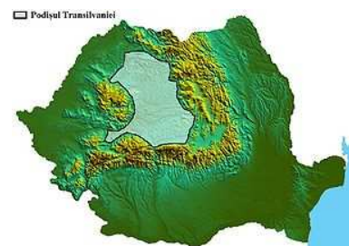
Mapa topogràfic de l'actual Romania

La carena de muntanyes emmarca aproximadament el perfil inferior de la regió de Transsilvània, que queda al seu nord-est. La zona de color gris representa l'altiplà de Transsilvània