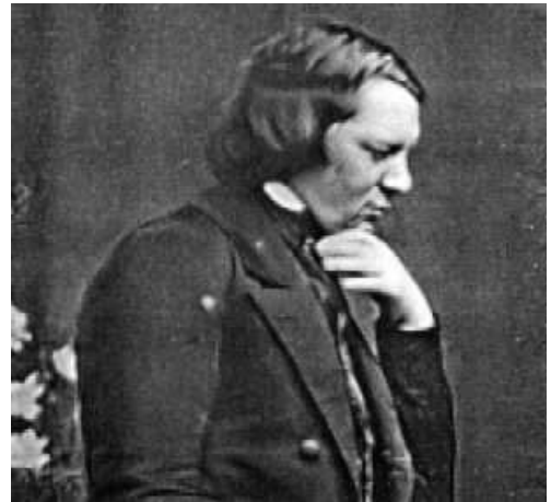
Robert Schumann, pels volts de 1850

Com a moviment capdavanter del Romanticisme, neix l' Sturm und Drang ("tempesta i passió", en alemany), moviment artístic i intel·lectual que reivindica el drama i el misteri. El "jo" de l'individu es revalorava; es recuperen i posen de moda temes com la nit, els boscos, la natura, la inspiració... Actuen com a profetes del moviment els grans poetes Schiller 5 i Goethe 6 , amb els seus herois d'ànima generosa i de sentiments irrenunciables, sensibles a les petites coses (l'any 1784, la publicació de l'obra Werther , de Goethe, va seguida d'una onada de suïcidis).