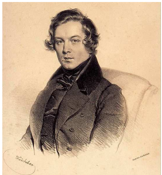
Robert Schumann, l'any 1839

Amb això, es veu apartat de la carrera de concertista i s'encamina cap a la composició. Mor un altre germà seu i entra en una nova crisi depressiva que el duu a les portes del suïcidi. Torna al costat de la seva mare i aconsegueix restablir-se. Altre cop a Leipzig, s'incorpora amb gran energia a la vida social i cultural de la ciutat, i funda una combativa revista dedicada a defensar les noves idees romàntiques ( Neue Musikalische Zeitschrift ) que de seguida tindrà gran ressò.