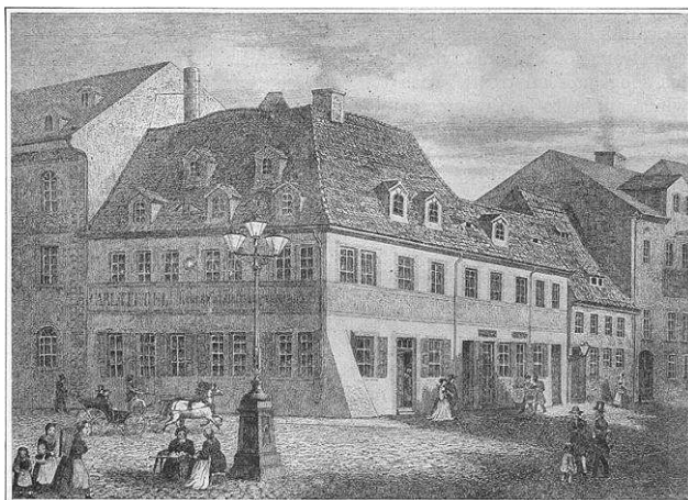
Casa natal de Robert Schumann, a Zwickau

Robert Schumann neix en el si d'una família benestant i envoltat de llibres, ja que el seu pare, home molt culte, era llibreter. A Robert, el petit de cinc germans, ben aviat l'apassiona la lectura. Quan té nou anys, assisteix a una representació de La flauta màgica de Mozart i a un concert de piano del gran virtuós Ignaz Moscheles i se li desperta la vocació de concertista.