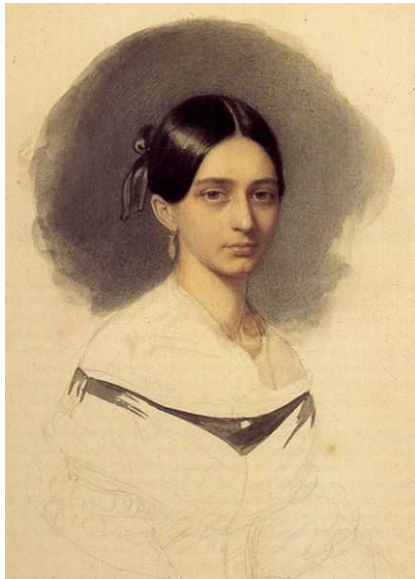
Clara Wieck, en un retrat de l'any 1840

una nena. Clara s'ha revelat com una concertista de piano de primera fila. A Robert l'envaeix un estat exaltat d'optimisme i de felicitat i sembla que tot gira al seu favor. Fa amistat amb Chopin i amb Mendelssohn, i comença a compondre a un ritme frenètic (d'aquest període provenen la majoria de les seves obres mestres). L'any 1838 es trasllada a Viena amb la seva revista, i coneix el fill de Mozart i el germà de Schubert. Per desgracia, el pare de Clara s'oposa obstinadament al matrimoni. Entre 1839 i 1840 Robert manté un plet per difamació contra el senyor Wieck que finalment es resol a favor del jove compositor. Al cap de cinc anys de lluites i patiments per defensar el seu amor, Clara i Robert es casen, el dia abans que Clara faci vint-i-un anys. Tot seguit, comencen una tranquil·la i feliç vida conjugal que els donarà vuit fills.