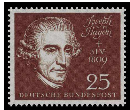
Franz Joseph Haydn, en un segell alemany de 1959

Franz Joseph Haydn, músic de tarannà humil i finíssim sentit de l'humor, és considerat una de les grans figures de la història de la música. Gràcies a la seva llarga vida va poder ser testimoni de l'evolució dels estils musicals des del final del Barroc fins a l'inici del Romanticisme passant pel Classicisme. Juntament amb Wolfgang Amadeus Mozart, se'ls considera els principals forjadors d'aquest estil, i a ell personalment se li atribueix la concreció de les formes de la simfonia i del quartet de corda, que tindran una importància cabdal en els períodes de la història de la música posteriors.