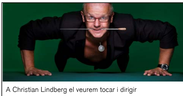
A Christian Lindberg el veurem tocar i dirigir

Christian Lindberg confessa que la primera idea sobre aquesta composició li va venir l'any 2003, durant un viatge en avió. Havia acabat de fer un concert que no li havia deixat gaire bon gust de boca. Estava begut, havia pres vi i whisky hores abans, i li va venir al cap un tipus de música que de ben segur no hauria aparegut si hagués estat sobri: algunes de les actuacions del Festival de