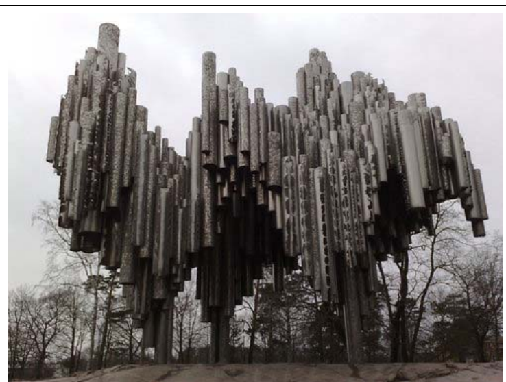
Monument a Sibelius, a Finlàndia

Tot i néixer a Finlàndia, l'educació i la cultura que rep és sueca. Pel que fa als estudis es va matricular de dret però ho deixà per la música. Volia ser virtuós del violí, però deixà la carrera de solista per la de compositor quan s'adonà que mai podrà arribar a ser un geni de la interpretació. Va completar la seva formació a Alemanya i Àustria. Aquesta etapa a l'estranger li desperta l'interès per la música orquestral. Anteriorment, ja havia escrit algunes composicions de cambra com ara tríos i quartets, i també una sonata per a violí i piano.